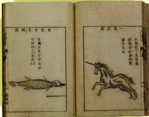
『一角纂考』木村遜斎 著 1795 (寛政7) 年刊