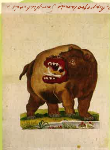
「宇田川榕菴蔵張込帖」江戸後期