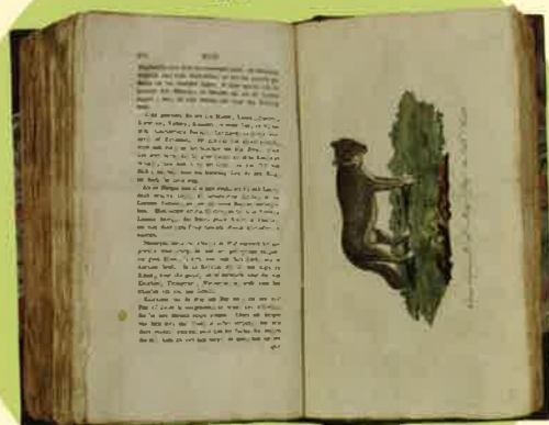
『ショメール家庭百科事典』 N・ショメール 著 1800~03年刊