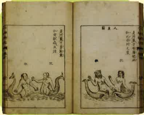
『六物新志』大槻玄沢 訳考 1786 (天明6) 年序