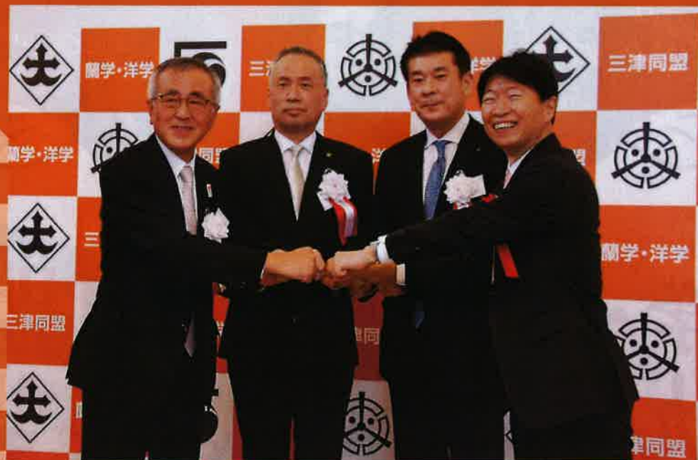
三津同盟調印式の様子

津山市・中津市・津和野町は、江戸時代、優れた蘭学者・洋学者を輩出したという共通の歴史を持っています。この歴史的背景をもとにして、3市町が相互に連携・協力して学術交流や観光振興を行うことを目的として、令和3年11月に「蘭学・洋学 三津同盟」を締結調印しました。