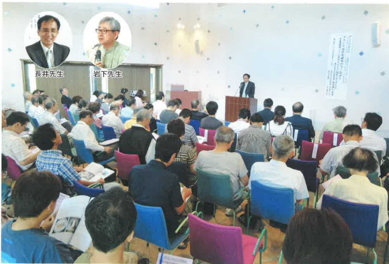
津山洋学資料館・上廣歴史文化フォーラム