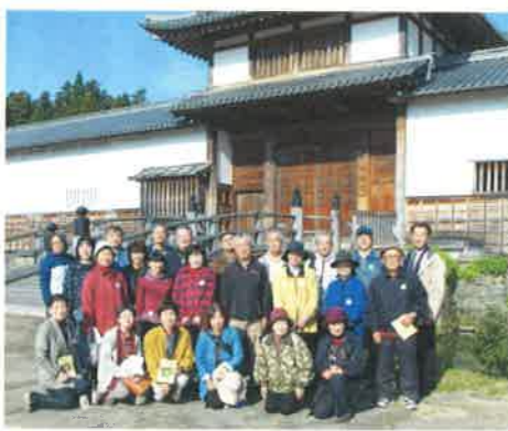
三日月藩乃井野陣屋館で記念撮影

三日月は、津山藩森家の改易後、分家の森長俊が移封した、津山とは縁の深い地です。最初に長俊が造営した陣屋跡を訪ねました。陣屋跡は、現在三日月藩乃井野陣屋館として整備されていて、出土した陣屋の瓦や鎧甲などが展示されています。陣屋近くには表門が