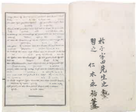
仁木家に伝わる『英吉利文典』