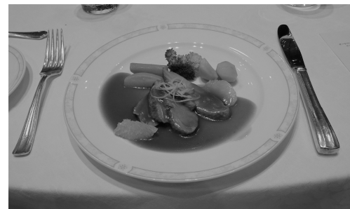
Braadeendvogel(ブラートルエントホーゲル)