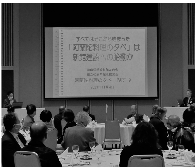
下山名誉館長と小島館長の対談の様子

阿蘭陀料理の夕べを始めたきっかけや、苦労された話など友の会の活動の歴史を語っていただきました。