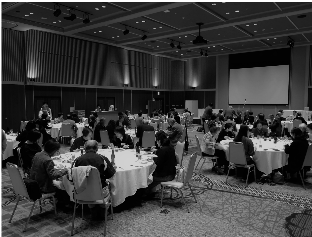
友の会創立40周年記念祝賀会