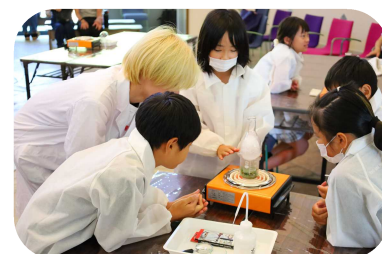
昨年の実験のようす