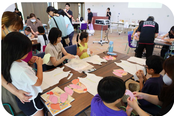
昨年 さねん のようす